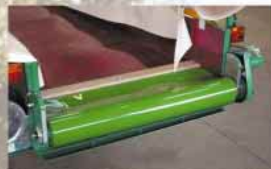
Vidage par fond mouvant débrayable.