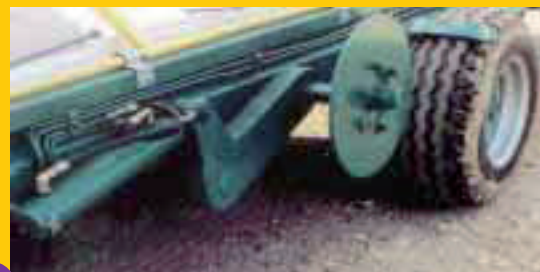
Disque de stabilisation (conseillé avec le secoueur à appui latéral)