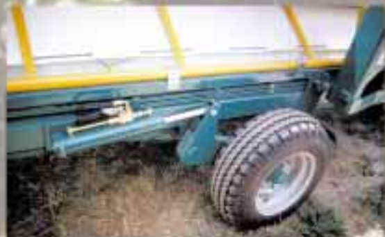
Réglage indépendant de la hauteur des roues.