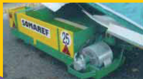
Tapis de déversement latéral avec ventilation