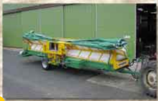
Position de transport