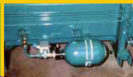
Accumulateur 4 ou 10 litres (secoueurs continus et à appui latéral)