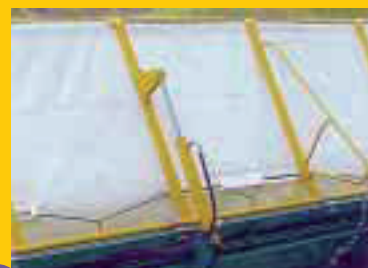
Panneau de récupération à levage hydraulique