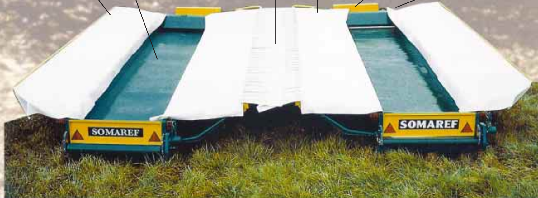
Timon directeur à déport hydraulique