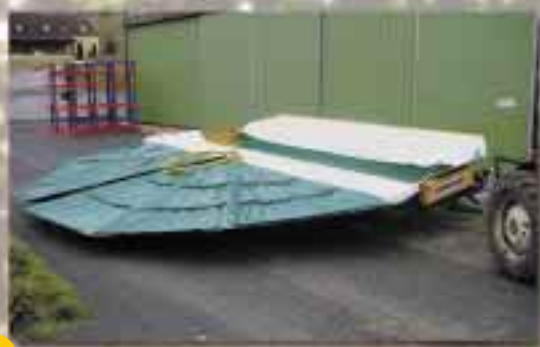
Position de récolte