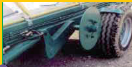
Disque de stabilisation (conseillé avec les secoueurs continu et à appui latéral)