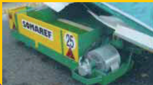
Tapis de déversement latéral avec ventilation