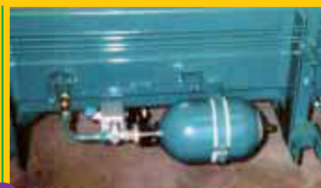
Accumulateur 4 ou 10 litres (secoueur à appui latéral)