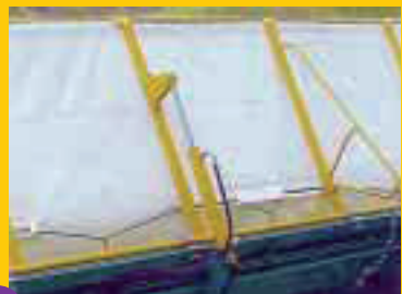
Panneau de récupération à levage hydraulique