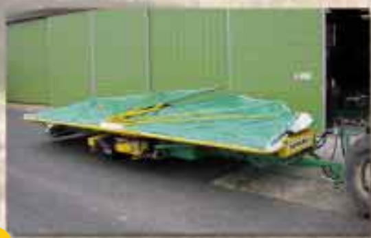
Position de vidage